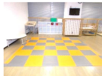
センターのプレイルーム

当センターでは、保育グループの協力により、全ての主催講座に一時保育を開設しています。子どものよりよい仲間づくりの場、地域に開かれた集団生活への導入につながるような保育をめざしています。1歳～就学前までお預かりします。初めての方も、安心してご利用下さい。