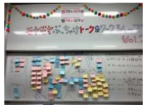
(モヤモヤぶっちゃけトーク&ワークショップ)