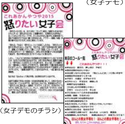
(女子デモのチラシ)