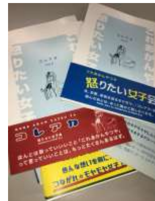
(ミニコミ誌「コレアカ」)